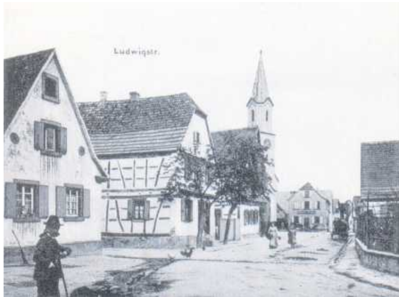
Die Aufnahme der Ludwigstraße entstand 1918

Der nächste FoKuS-Treff des Heimatvereins Maximiliansau findet am Freitag, 29. Mai, um 19 Uhr im Bürgerhaus statt. Interessierte an alten Bildern und oder der Ortsgeschichte sind herzlich eingeladen, im Archiv zu schmökern oder sich mit den Teilnehmern auszutauschen. Nähere Informationen unter Tel. 07271-923485 (Stefan Eck), www.pfortz-maximiliansau.de , auf Facebook oder Instagram.