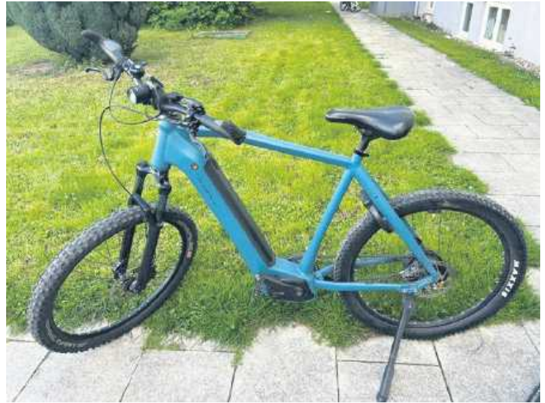
Wem gehört dieses Fahrrad?

Der Besitzer des Fahrrads soll sich bitte bei der Polizei Wörth am Rhein melden.