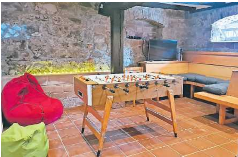
Blick in den neuen Jugendraum

Das Programm am Eröffnungstag bot für jede Altersgruppe etwas: Am Reflexisch und im Subsoccer-Käfig wurde sportlicher Ehrgeiz geweckt, während auf der PlayStation 5 die Welt von Minecraft zum Leben erwachte. Kreativangebote luden zum Mitmachen ein, und bei leckeren Snacks und angeregten Gesprächen lernten die Kinder, Jugendlichen und Erwachsenen die Einrichtung kennen.