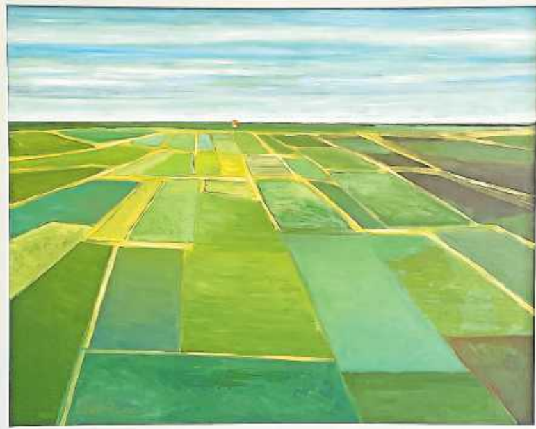
„Tiefebene“ von Werner Müller

Das WissensWerk Wörth freut sich auf zahlreiche Gäste und einen stimmungsvollen Ausklang der Ausstellung.