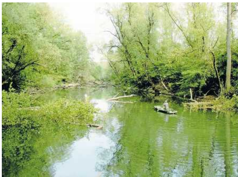
Die geführte Fahrradtour des Heimatvereins FokuS führt durch den Auwald „Goldgrund“

Der kostenlose Flyer „Radel ins Museum 2026“ steht im Internet zum kostenlosen Download zur Verfügung oder kann beim Südpfalz-Tourismus Landkreis Germersheim e.V. unter: info@suedpfalz-tourismus.de sowie bei den Tourismusbüros und Verwaltungen im Landkreis Germersheim ebenso wie die kostenlose Radkarte Südpfalz angefordert werden. Ergänzend gibt es eine interaktive „Radel ins Museum“-Tour, mit der sich die Museen im Landkreis Germersheim auch unabhängig vom Aktionstag entdecken lassen.