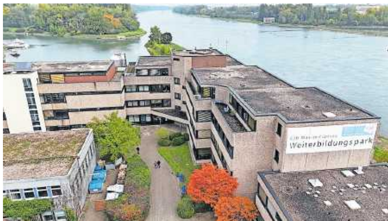
Blick von oben auf das Hauptgebäude auf dem ehemaligen CJD-Gelände direkt am Rhein