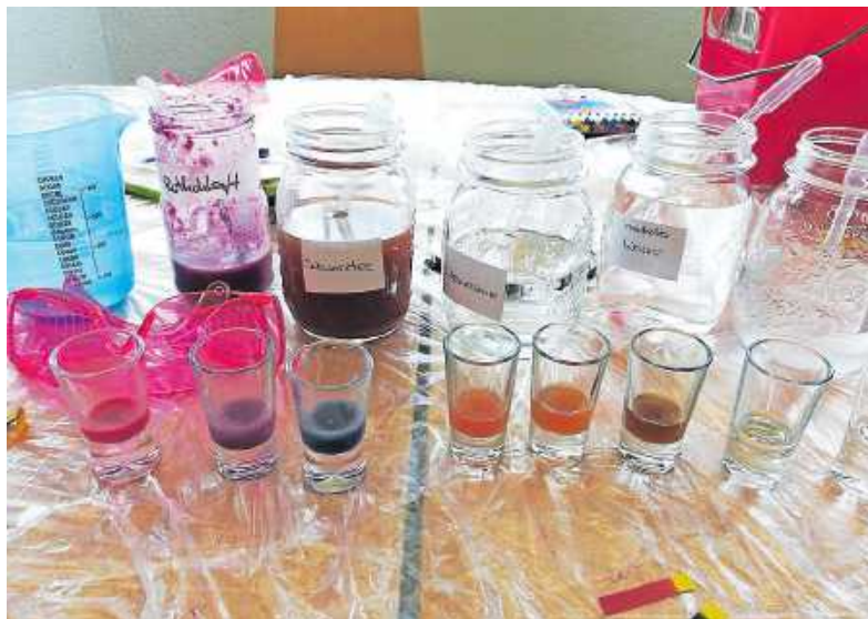
Ein Programmpunkt beim Ferienprogramm waren naturwissenschaftliche Experimente

Vulkanausbruch durch. In den Lego-Workshops, die am Nachmittag stattfinden, bauten und programmierten die Schüler dann mit großem Eifer Maschinen, Geräte und Fahrzeuge. Die vom Bundesministerium für Bildung und Forschung geförderte Initiative hat zum Ziel, das Interesse von Kindern an den MINT-Fächern zu wecken.