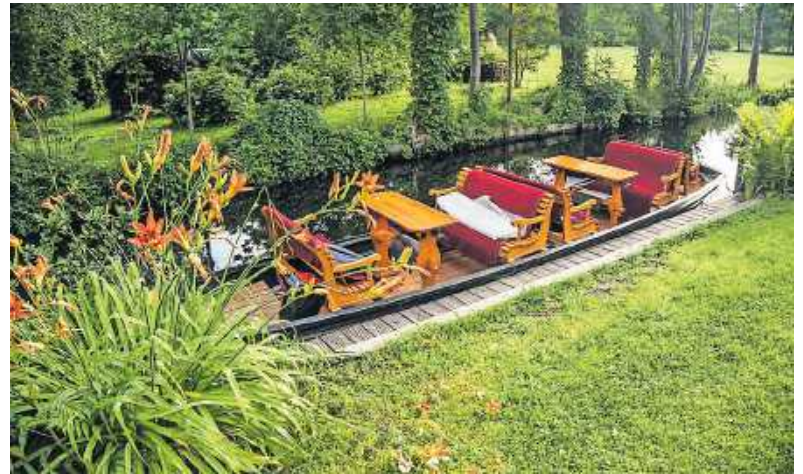
Im Programm enthalten: eine mehrstündige Fließfahrt auf einem typischen Spreewald-Kahn

Infos und Anmeldung bei Hannedora Klippel-Edel, Tel. 07271-6681 (Seniorenbeirat Wörth am Rhein).